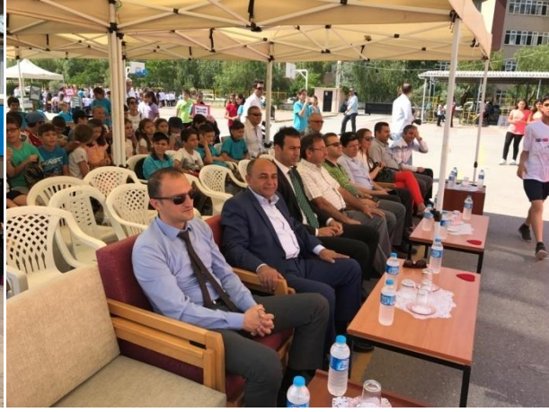
( Mini olimpiyata heyecanla başladık.)