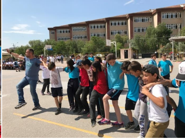
( Halkoyunlarıyla başlayan mini olimpiyatın coşkusu hepimiz sardı.)