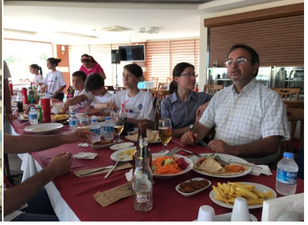
( Projeye verdiği büyük destekler için belediye başkanımıza teşekkürlerimizi sunduk.)