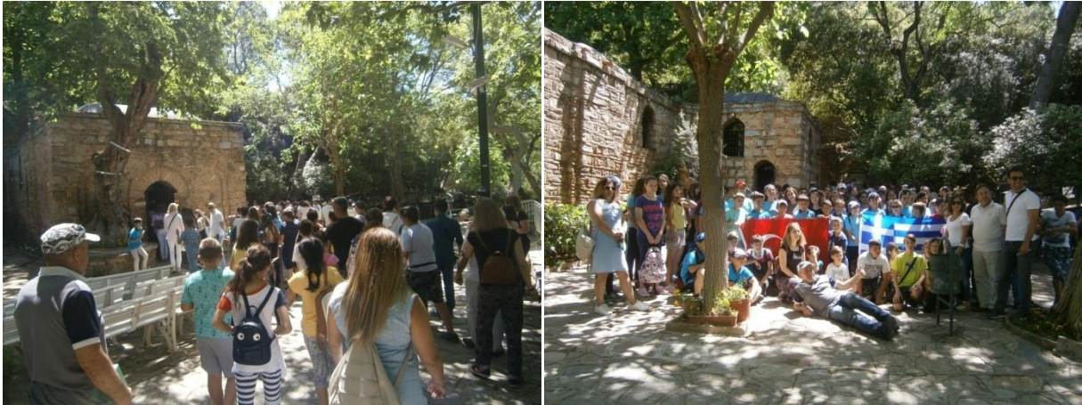
( Meryemana Kilisesi ziyaretimizden görüntüler.)

İkinci günümüzde ilimiz Selçuk ilçesinde bulunan Meryemana Kilisesi, Efes Antik Kenti ve Şirince Köyüne gezi düzenledik. Sabah erken saatte bulduğumuz okulda misafir öğretmen ve öğrencileri ile okulumuz öğretmen ve öğrencileriyle büyük bir mutlulukla yola çıktık. Yolda öğrencilerimiz ile misafir öğrenciler kaynaşip dostluklarını pekiştirdiler. İlk önce Meryemana Kilisesini gezip kutsal olduğuna inanılan çeşmelerinden su içtik ve iyi dileklerde bulunduk.