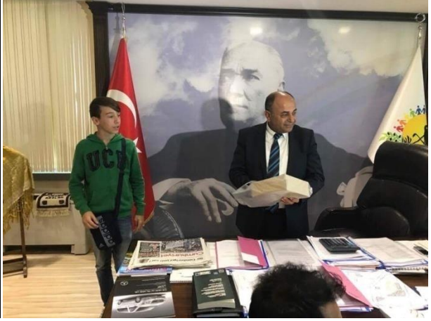
(Mini Olimpiyata için ilçemiz yöneticilerini davet ettik.)

Bu ziyaretlerin ardından ilçemizin en büyük ilkokulu olan İsmail Rahmi Karadavut İlkokulunu ziyaret ettik. Halk oyunlarıyla karşılandığımız okulda çiğ köfte yiyerek kültürümüzün farklı yönlerini Yunan dostlarımıza tanıttık.