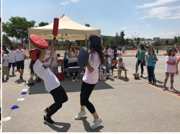
(Cenk meydanındaki mücadele görülmeye değeri.)