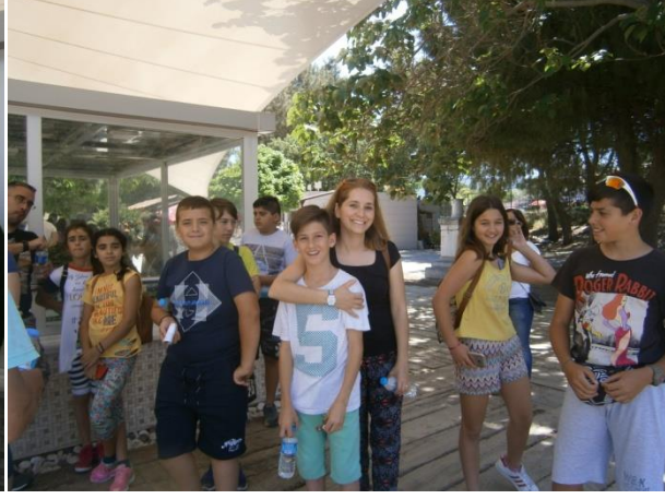
(Rehberimiz eşliğinde Efes Antik kentinin özelliklerini tam anlamıyla öğrendik.)