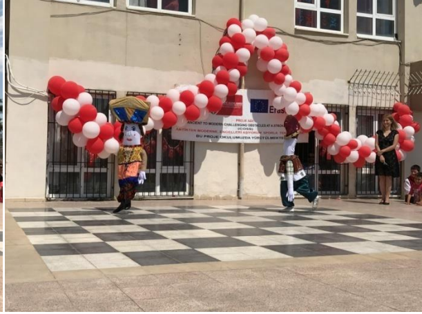
( Harmandalı halk oyunumuz ve Âşık ile Maşuk oyunumuzu sergiledik.)

Açılış konuşmaları, halk oyunları ve tanıtımın ardından mini olimpiyatın açılışı pentatlon ile başladı.