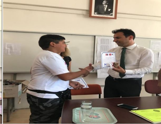
(Misafirlerimizin okulumuzdaki son günlerinde proje katılım belgelerini aldılar.)