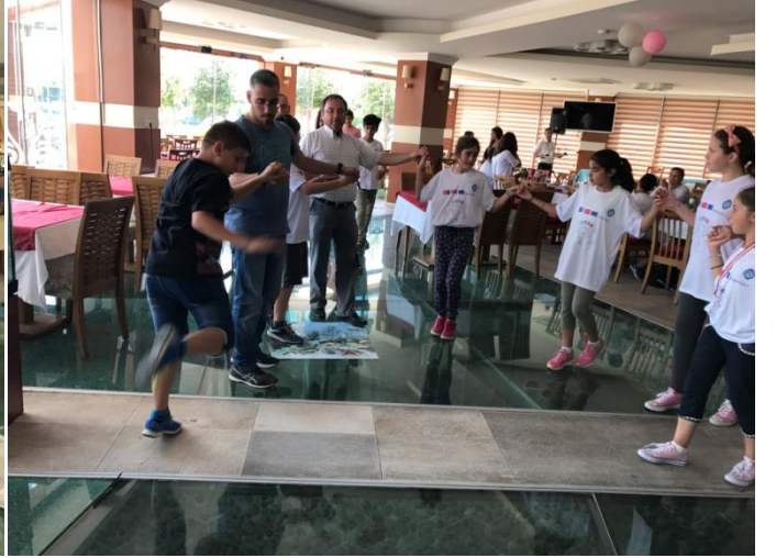
( Dostluğumuzu Yunan halk danslarıyla perçinledik.)

Misafirlerimizle sohbet edip dinlendikten sonra Karşıyaka 'da bulunan Bilim Müzesini ziyaret ettik. Görevlilerin anlatımıyla bilimin sınırlarını kavramaya çalıştık. Uygulamalar ve görseller yoluyla bilimin derinliklerini algılamaya çalıştık.