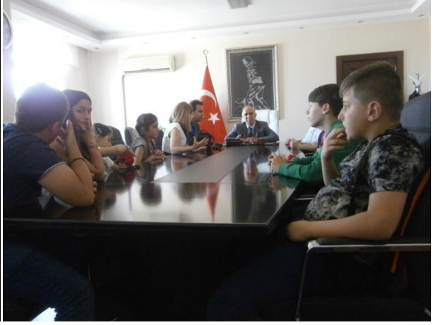
( Projemize tüm ilçe yöneticileri destek verdi.)