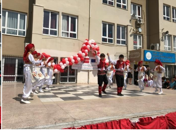
( Üsküp halk oyunu gösterisi sunduk.)